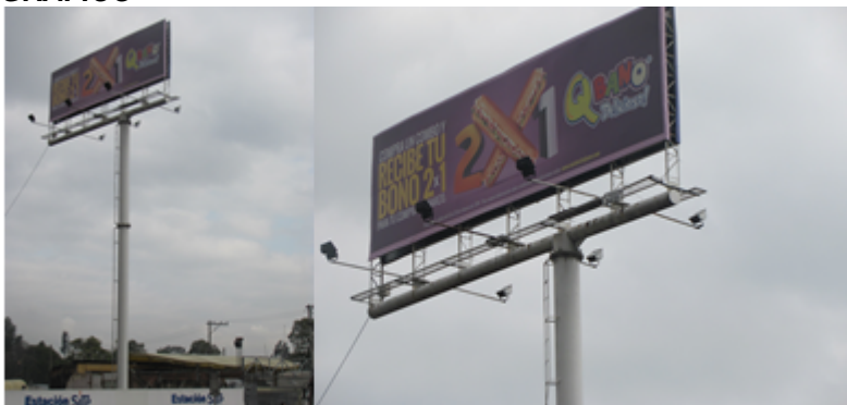
VALLA INSTALADA ANUNCIA SENTIDO SUR - NORTE : QBANO DELICIOSO 2X1